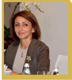
تناغم الفن المعاصر في معرض "بوب وول" في كورتيارد غاليري